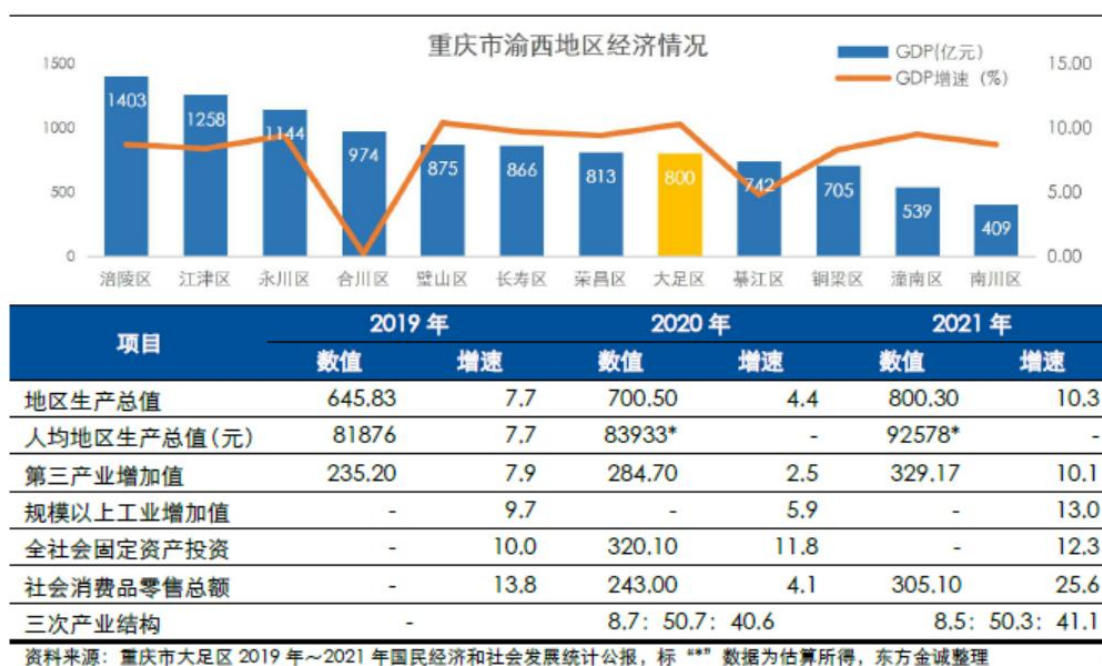
大足区主要经济指标情况（单位：亿元，%）

拥有双桥经开区、大足工业园区、大足高新技术开发区三个成熟工业集聚区。其中，双桥经开区作为中国重型汽车工业的“摇篮”，产业基础扎实，形成了以汽车及零部件、现代装备制造为支柱的产业体系；大足工业园区拥有中国西部最大、配套最全、辐射最强的五金市场群；大足高新技术开发区重点打造智能制造装备、环保装备和台湾智慧经济示范区三大产业基地，获批为市级智能制造装备产业基地。