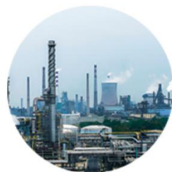
精细化工产业和石油化工产业

产业基础：泰州市精细化工产业集聚了近20家世界500强企业，拥有10多个世界“单打冠军”产品，氯碱、烯烃等优势产业链较为完善，初步形成集群发展态势。