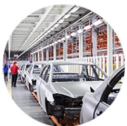
汽车及零部件产业