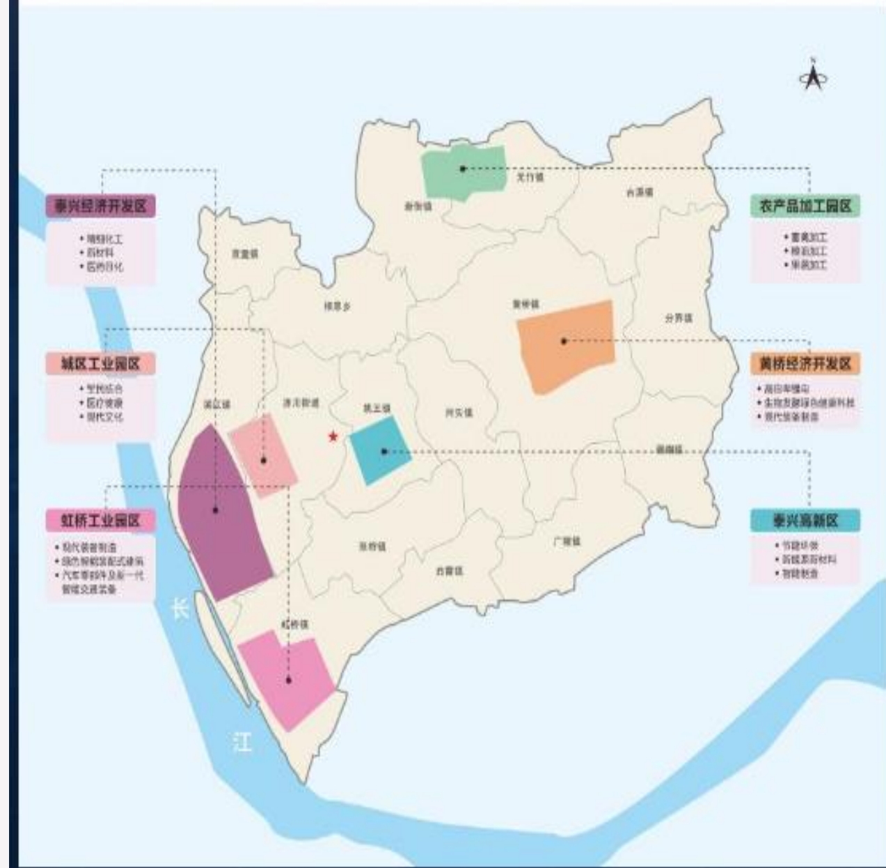
泰兴市重点区域产业定位图