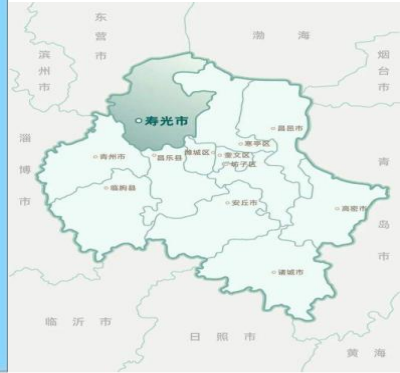
▲ 山东省区域和城镇协调布局图

寿光市，隶属于山东省潍坊市。位于山东省中北部，潍坊市境西北部，渤海莱州湾西南岸，南部沃野平畴，水源丰沛，北部石油、天然气资源丰富，是“中国蔬菜之乡”和“中国海盐之都”。